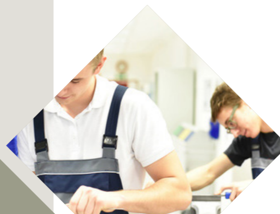
Conception Prathis, dans le cadre d'un groupe de travail du PRITH Réalisation Agefiph DR51-DCOM Janvier 2017