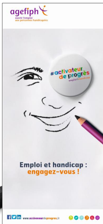
ROLL-UP « Engagez-vous »