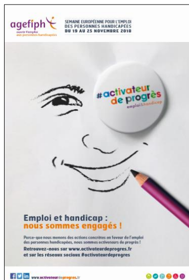
AFFICHE 2 « Nous sommes engagés »

0,50 € HT*/unité Minimum 100 par commande