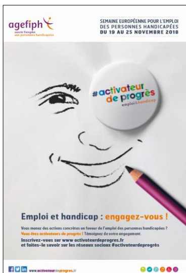
AFFICHE 1 « Engagez-vous »